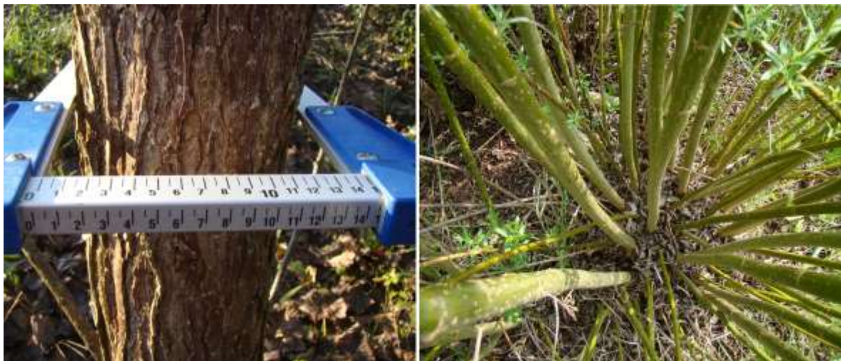
Abbildung 5: Je stärker das Holz umso geringer der Rindenanteil!

Der Nährstoffentzug durch Ernte hängt vom Ertragsniveau, Baumart, Stammzahl und Umtriebszeit ab. Erntegut mit schwachen Dimensionen hat einen hohen Rindenanteil. In der Rinde sind die Anteile von Nährstoffen höher als im Holz. Deshalb sind bei Umtriebszeiten von 2 oder 3 Jahren oder Ernte von stammzahlreichem Stockausschlag die Nährstoffentzüge wesentlich höher als bei Umtriebszeiten von 8 bis 10 Jahren und stärkeren Dimensionen des Ernteguts. Tabelle 9 zeigt die Nährstoffgehalte von Pappeln und Weiden im Erntegut.