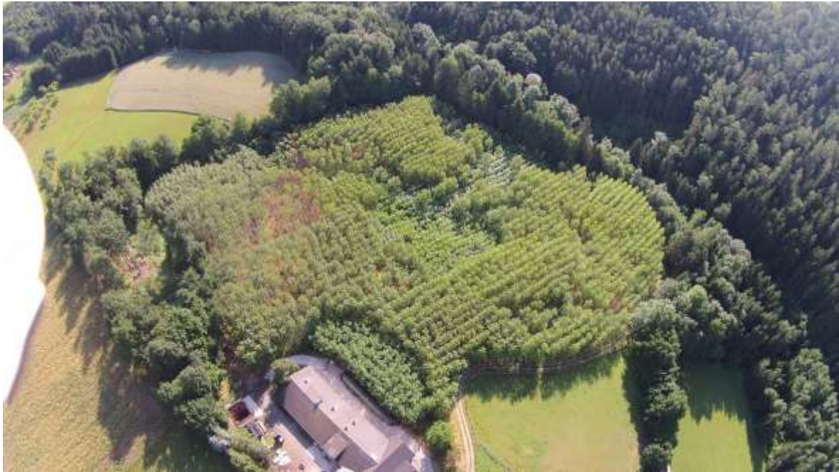
Abbildung 2: Nachpflanzung von Pappeln nach Forstschäden in gefährdeter Lage

Die mechanische Bekämpfung des Begleitwuchses und dauernde Bodenoffenhaltung führt zu ausreichender Bodendurchlüftung und ist beste Voraussetzung für gute Zuwachsleistungen.