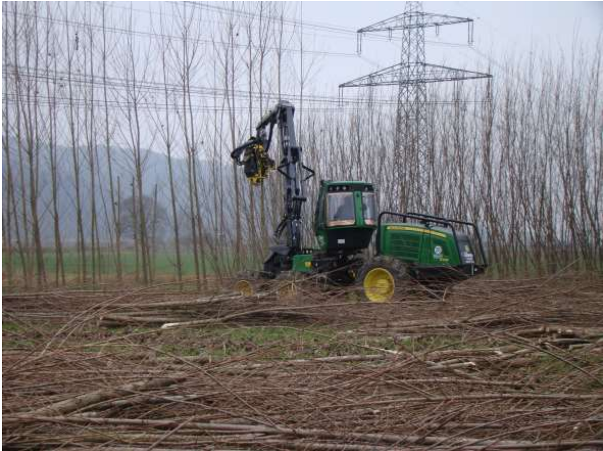
Abbildung 6: Ernte mit Harvester, ausgestattet mit speziellem Energieholzernteaufsatz