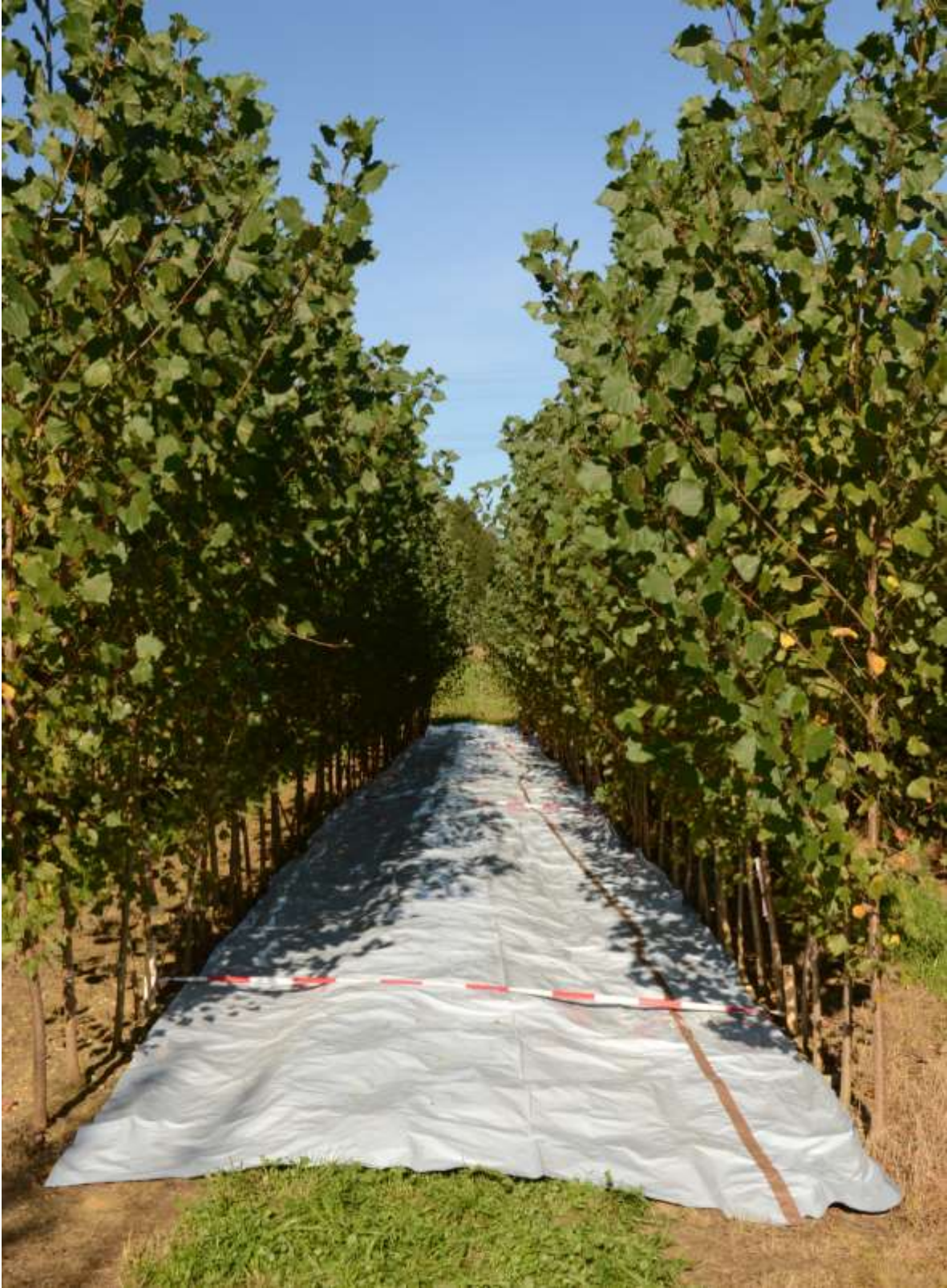
Abbildung 7: Bei Nährstoffentzug ist auch der Bedarf der Blätter zu berücksichtigen - Blattmengenbestimmung mit ausgelegter Folie