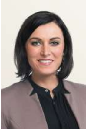
Elisabeth Köstinger Bundesministerin für Nachhaltigkeit und Tourismus

Holz ist eine der wertvollsten natürlichen Ressourcen. Der nachwachsende Rohstoff kann nicht nur stofflich verarbeitet, sondern auch für eine nachhaltige Energiegewinnung eingesetzt werden – gerade in diesem Bereich wächst der Bedarf stetig. Baumbiomasse ersetzt fossile Energieträger und zeichnet sich somit durch eine günstige CO 2 neutrale Kohlenstoffbilanz aus.