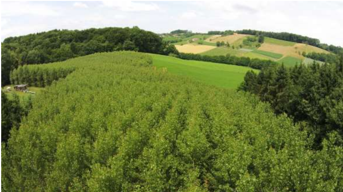
Abbildung 1: Pappel im 3. Wuchsjahr bei mehrjährigem Umtrieb

Bei der Ernte von Kurzumtriebskulturen werden nicht nur das Stammholz, sondern auch die Feinäste genutzt und von der Fläche gebracht. Dementsprechend hoch ist auch der Nährstoffentzug, der zwischen dem der landwirtschaftlichen und der forstwirtschaftlichen Nutzung liegt.