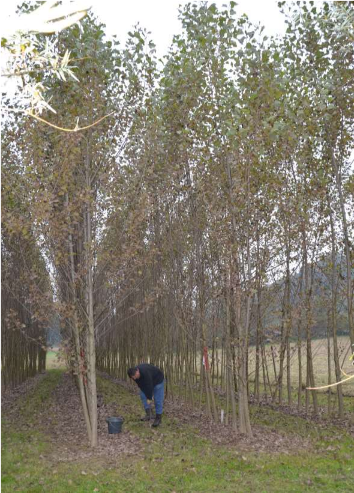
Abbildung 3: Probenahme